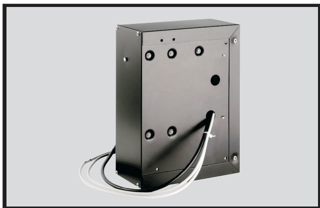
Fijación lateral Lateral instalmen

Su reducido tamaño permite su incorporación en cualquier espacio y máquina.